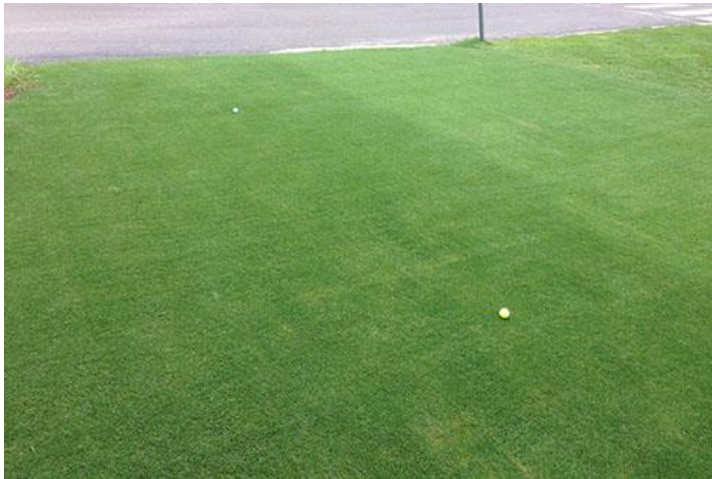
左 ティフランド 右 ティフウェイ(ティフトン419)