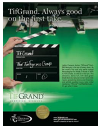
広告をとってください